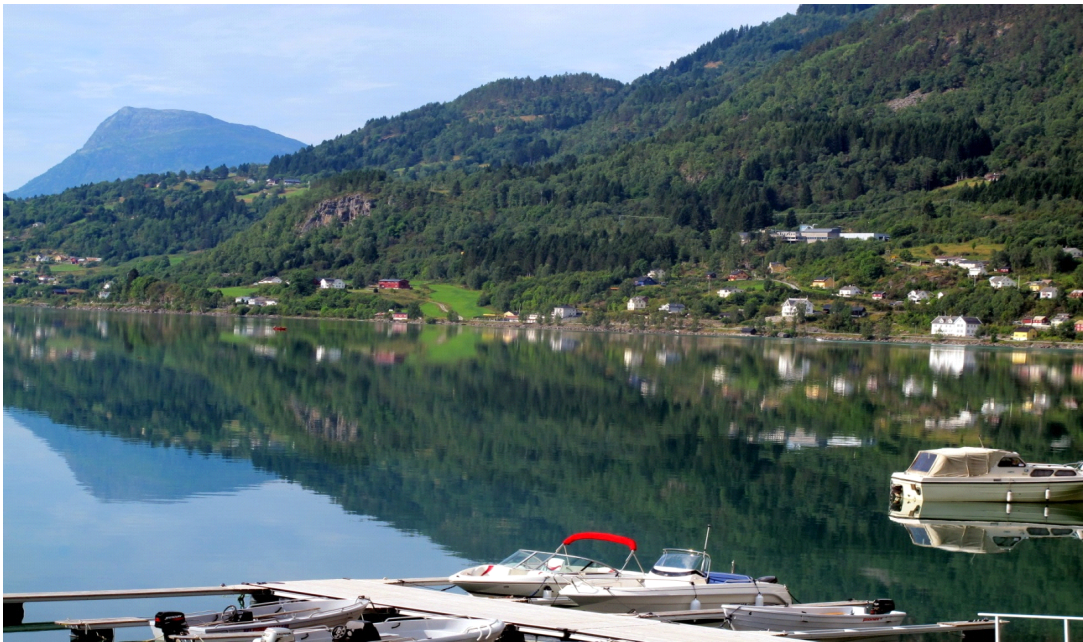
Myrane ligger i området rundt og til venstre for det store hvite huset ved fjorden