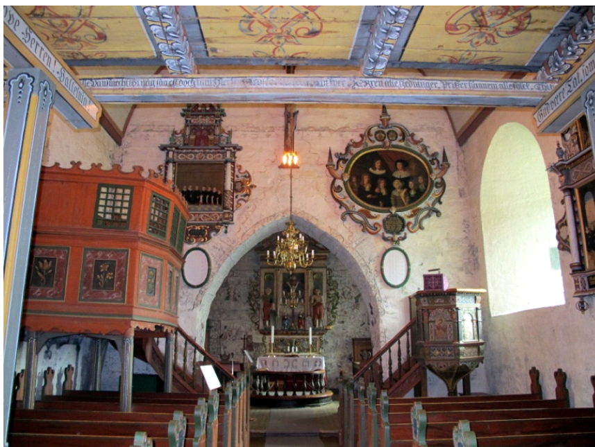
Dale kirke er fra 1200-tallet, den er meget rikt dekorert.