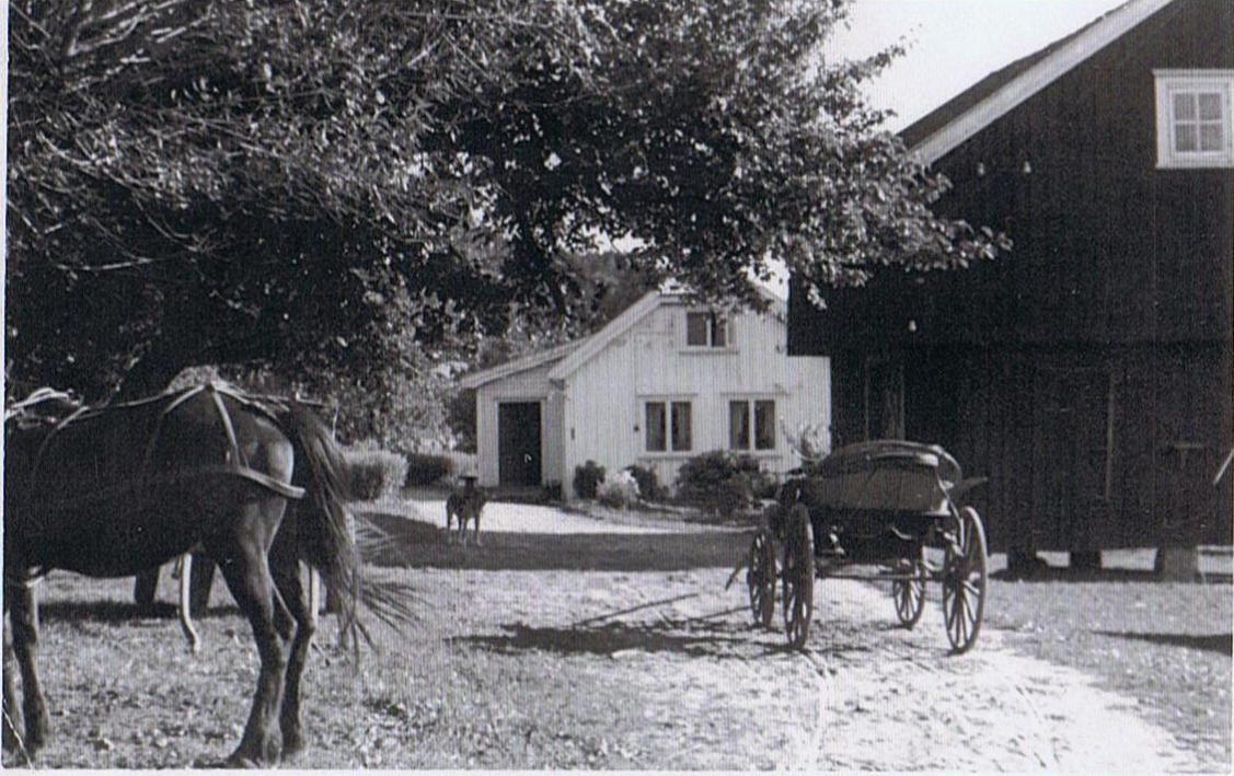
Fra Høyum gård

Hovedbygningen hadde egentlig ligget lengre opp i lia. og var blitt flyttet – til det stedet på gården som vi er kjent med. Jeg antar at huset var et sent 1600- talls hus. Det ble det revet ca.1990.