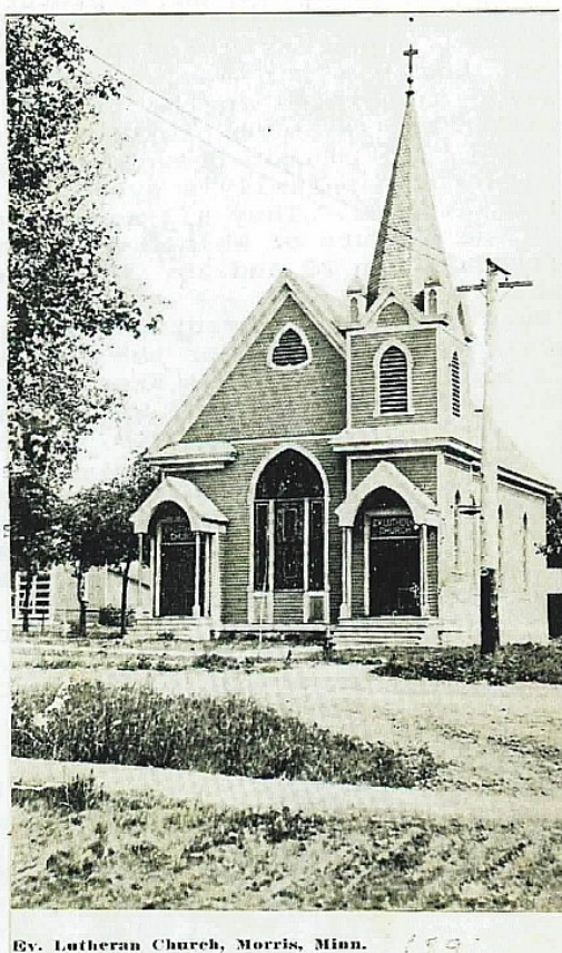
Ev. Lutheran Church, Morris, Minn.