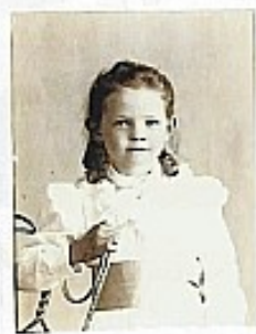
BROCKE 14 yr