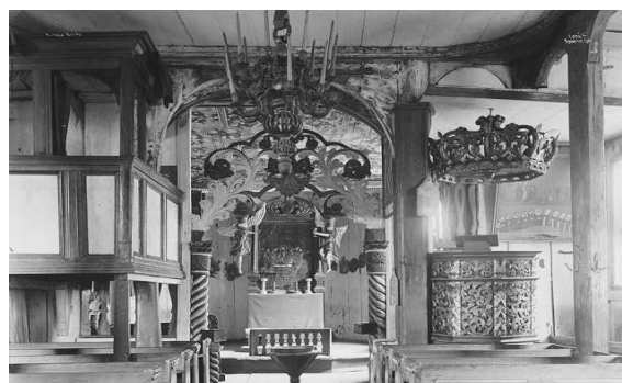
Lom stavkyrkje interiør

Fol 52 som født 1823 Juni 30.de og døbt s.aa.